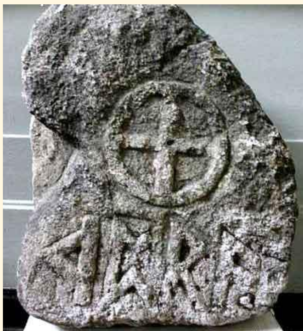
Камень с «рунами» из города Киммерик.

Во время раскопок городища Киммерик на горе Опук в Ленинском районе Керченского полуострова, семнадцать лет назад, в 1996 году, археологи обнаружили известняковую плиту-стелу, на видимом краешке которой был высечен крест. Когда же плиту извлекли полностью, оказалось, что она – настоящая сенсация, раньше такого не находили: под заключённым в крест кругом были высечены четыре рунических знака. Плиту датировали концом IV века и назвали свидетелем перехода готских племён в христианство. Однако надпись оказалась нечитаемой, что породило множество споров. Была версия магической формулы: якобы плита должна была содействовать установлению справедливости при суде. – Из средств массовой информации.